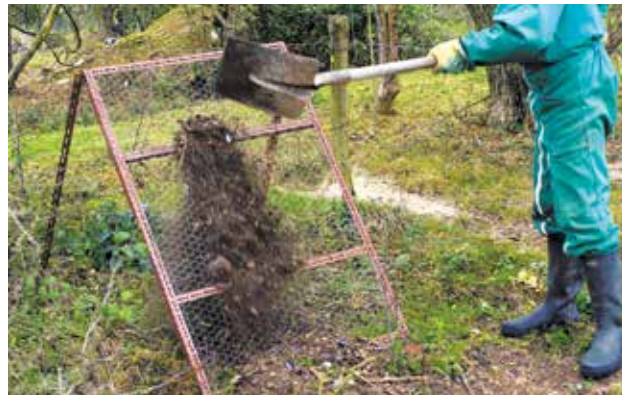
Pour tamiser, un simple grillage posé sur un cadre peut faire l'affaire.

Le tamisage permet d' affiner le compost et de l'utiliser plus facilement . Il permet d'éliminer les éléments grossiers qui n'ont pas été complètement transformés.