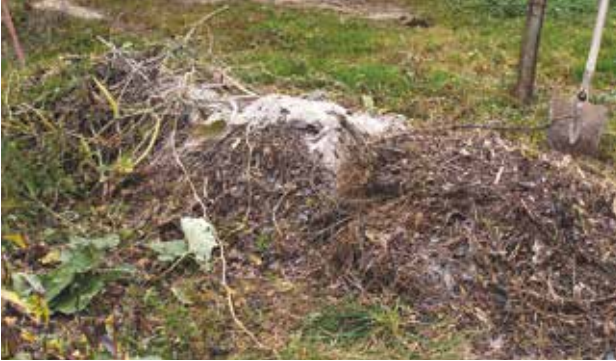
Le compostage en tas est pratique si vous disposez de place mais de peu de temps à y consacrer.