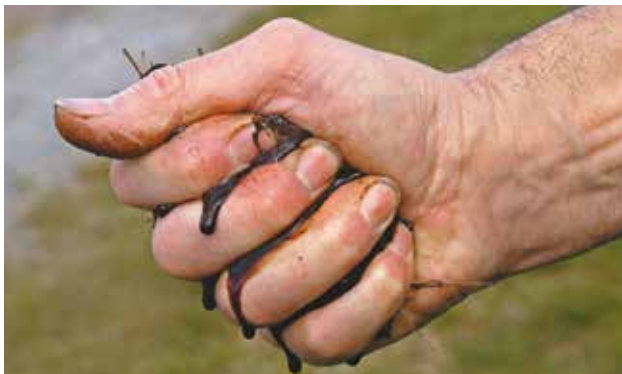
Le compost doit être humide (comme une éponge pressée) mais sans excès. Si du liquide sort d'une poignée de compost pressée, il est trop humide.

Trop d'humidité empêche l'aération : le compostage est freiné et des odeurs désagréables se dégagent. Si c'est le cas, on peut étaler le compost quelques heures au soleil ou le mélanger avec du compost sec ou de la terre sèche. Pas assez d'humidité : les déchets deviennent secs, les micro-organismes meurent et le processus s'arrête. Il faut alors arroser le compost.