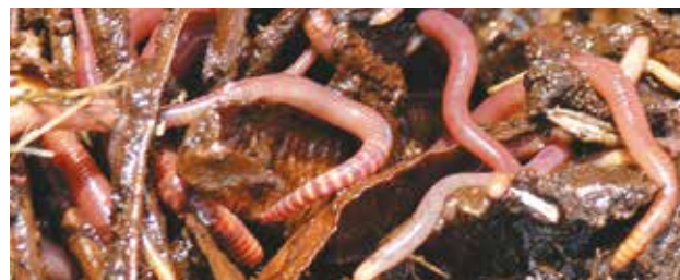
Des vers de fumier, cheville ouvrière du lombricompostage.

Attention, les lombrics provenant de la terre d'un jardin ne conviennent pas pour le lombricompostage.