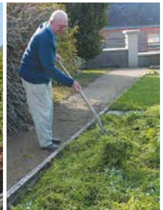
Il est possible de pailler avec des feuilles mortes ou des herbes fraîches.