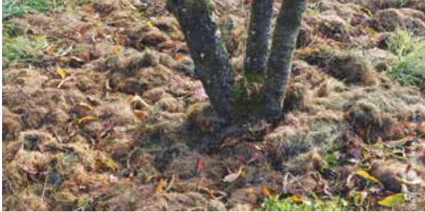
De la tonte de gazon est épanchée au pied d'un arbre.

Il exige peu de temps et vous évite les déplacements en déchèterie.