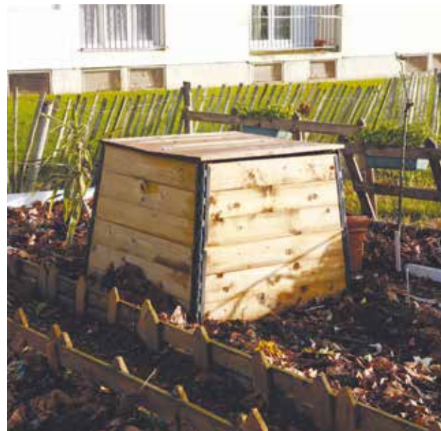
La pratique du compostage partagé se développe de plus en plus.

Dans votre immeuble, votre résidence ou votre quartier, parlez-en autour de vous pour savoir si des habitants voudraient participer; mobilisez vos voisins, c'est un des gages de réussite d'une telle opération.