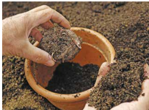
Le compost doit être mélangé avec de la terre quand il est utilisé en support de culture.

Pour la création de nouvelles jardinières, un bon mélange est constitué d' un tiers de compost, un tiers de terre et un tiers de sable . Si vous réutilisez des jardinières de l'année précédente, vous rajouterez 20 % maximum de compost à la quantité de l'ancienne terre. Vous pouvez aussi l'utiliser pour vos plantes d'intérieur de la même façon.