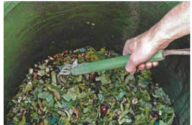
Le brassage des déchets est une des conditions de la réussite d'un compost.

réaliser un brassage régulier (notamment au début du compostage lorsque l'activité des micro-organismes est la plus forte, puis tous les 1 à 2 mois). Le brassage permet de décompacter le compost, de l'aérer et d'assurer une transformation régulière .